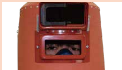
窓がしっかり目元に来ます。

2022年4月1日より溶接ヒュームが特化則で規制されてマンガン濃度を測定し測定結果に応じた防護性能のマスクを選択し使用することが義務付けられました。そのため従来の防塵マスクより大型の電動ファン付マスクの使用が必要な溶接作業現場でのご要望を多々頂き、大型溶接面を製造・販売開始いたしました。