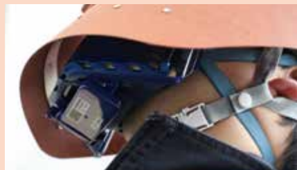
大型なのでマスクにあたりません。